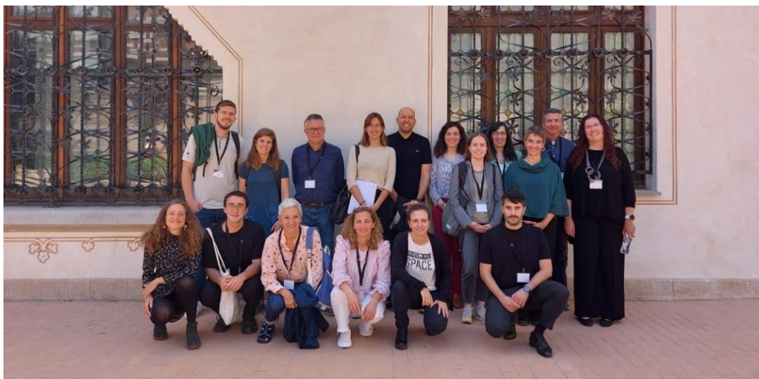
Els assistents de la Jornada de presentació del projecte de recerca "SCHOOL_MEALS".