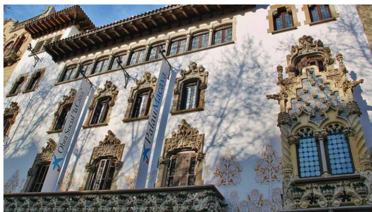
Palau Macaya Fundació La Caixa (Barcelona)

En aquesta ocasió, també volem fer un especial agraïment a la Fundació La Caixa per cedir-nos un espai al meravellós Palau Macaya , per tal de celebrar la Jornada de presentació del projecte de recerca "SCHOOL_MEALS". Posteriorment, vam gaudir d'una bona estona de networking .